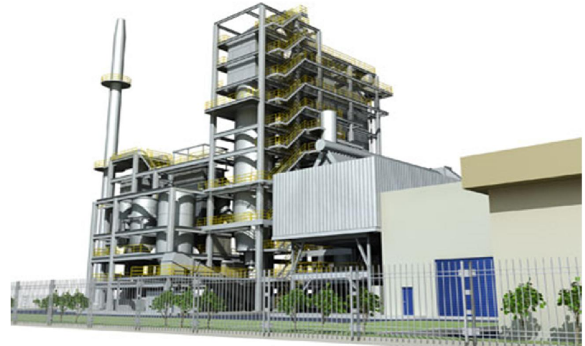
Hình: Phối cảnh NM sản xuất điện từ rác thải Nam Sơn, Hà nội.

dựa trên lượng rác được thu gom toàn bộ, và phần lớn được chuyển hóa thành năng lượng. Ở cấp độ này, đến năm 2030 có khoảng 75 MW được lắp đặt và đạt 575 MW vào năm 2050.