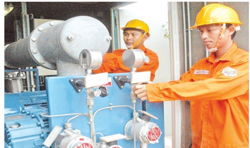
Hình: Vận hành trạm sản xuất điện từ rác tại bãi rác Gò Cát.

rác thải được xử lý hiệu quả do vậy việc tăng công suất lắp đặt là đáng kể dựa trên lượng rác được thu gom toàn bộ, và phần lớn được chuyển hóa thành năng lượng. Ở cấp độ này, dự kiến đến năm 2020 có khoảng 52 MW được lắp đặt và sẽ đạt khoảng 202 MW vào năm 2030. Năm 2050 dự kiến sẽ có 602 MW công suất được lắp đặt.